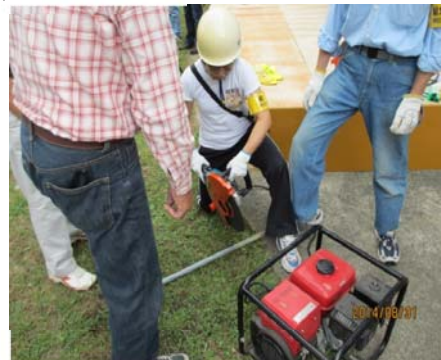
発動発電機による仮設照明と電動カッターの操作訓練