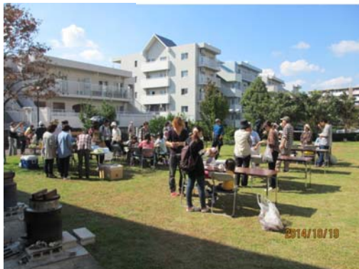
蒸かし芋と焼き芋で一休み