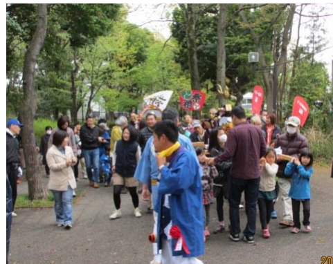
八幡神社のお神輿とウェルシーの子供お神輿