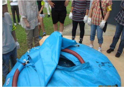
仮設電源（発動発電機）で水中ポンプを稼動し、地下仮設給水タンクから地上の給水タンクへ揚水訓練