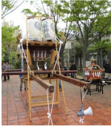
4月 八幡神社御 神輿