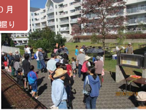
参加者の確認と出発