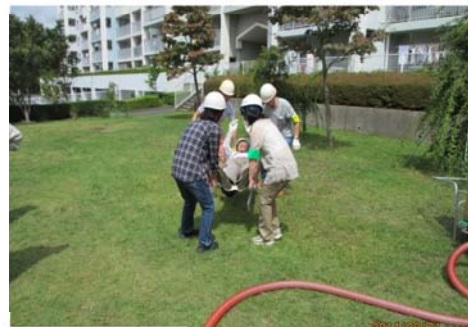
簡易担架の組立てと搬送訓練