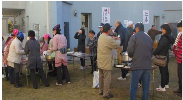
大根もち作りと災害時非常食の作りかた説明