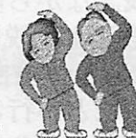
身体障がい者・高齢者パソコン講習会

11月21日(水) 「音楽療法」 午後1時半～3時 65歳以上 25人 (申込先着順)