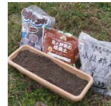
プランター型猫用トイレ