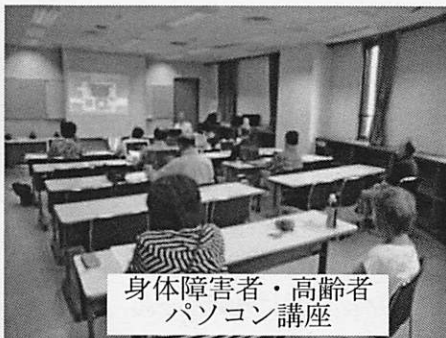
身体障害者・高齢者 パソコン講座