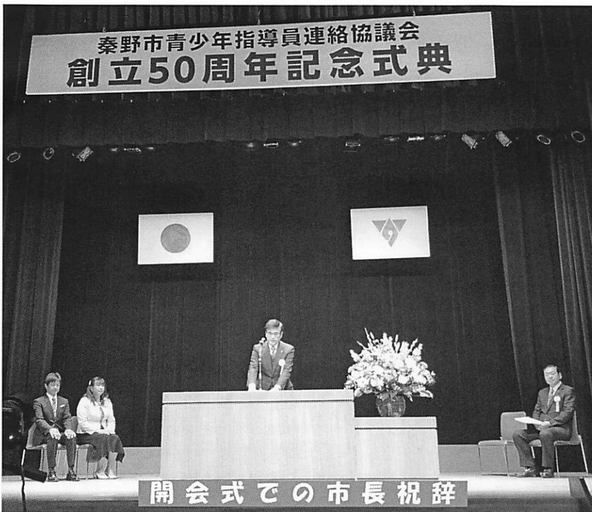
開会式での市長祝辞