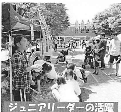
ジュニアリーダーの活躍

北地区は主に綿菓子とかき氷を担当しました。最初、綿菓子が割りばしに絡まず細くなってしまうこともありましたが、そのうち慣れてふつくとした白とピンクの綿菓子が