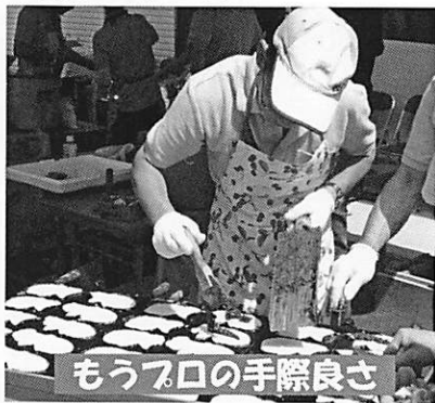
もう一口の手際良さ

西・上地区では昨年に引き続き、たい焼き、ポン菓子、ポップコーンの製造販売を行いました。