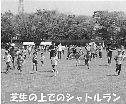
芝生の上でのシャトルラン