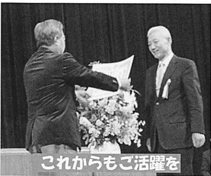
これからもご活躍を

ゲーム 今年に従来の陸上競技場フィールドが使用できず、体育館前スポーツ広場の土の上での開催となりました。土の会場では転倒による怪我が懸念されます。Uターン縄跳び、同ドリブルキックの二種目に縮小し、実施しました。模擬店が賑やかに並ぶ体育館前コースから一段低くなった会場は分かりづらく、参加者が少なかったのが残念です。それでも時間にゆとり