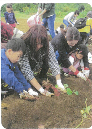
自然体験活動の一つ「いもっ子クラブ」

すい場所づくりに 協力する。 （3）構成団体が ら挙げられた問題 解決には役員だけ ではなく地域の方 と共に取り組む模 索する。 （4）積極的に情 報を取り入れ、各 種団体と共有する。 例えば、現在学 校は「地域学校協 働活動の推進に関 する社会教育法の 改正」に伴い、コ ミュニティ・スク ールが2019年に は南が丘小・中学 校で始まる予定で