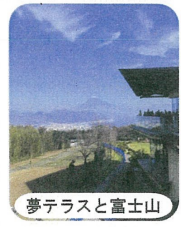
夢テラスと富士山

☆ある自治会(南子連未加入) ↓九自治会 ☆ない自治会 ↓十五自治会 ※南地区子ども会育成連絡協議会