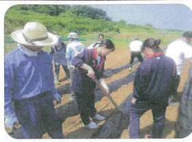
まずは苗を植える穴あけから

子どもたちのために企画している農業体験、いもっ子クラブ。今年度も五月二十日に苗植えを、十月二十日に収穫を行いました。例年は、天候に悩まされますが、今年は、なんとイノシシが畑近くに出没し、苗植えができるのか、やきもきさせられました。しかし、延べ三百名以上の参加者を迎え無事に終えることがで