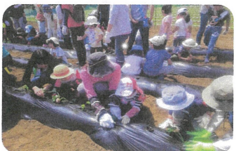
苗植えに参加すると収穫ができるよ