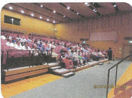
今年度も大勢参加いただいた講演会

育成部会一丸となっ て目的達成にまい 進めたいと思います 引き続きご協力を お願ひします。