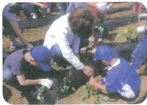
やさしく苗を植えていきます

今年は、ホクホク系のベニアズマとねっとり系の紅はるかの二種類を植えました。ボランティアとして