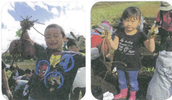
いよいよ収穫 大きなおいもがとれました

今回は月↓金星↓木星↓火星の順に観測。土星の輪、月のクレーター、木星とその周りを巡る四つ