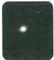
天文部の生徒さんから頂いた写真 左から木星とガリレオ衛星・月・土星

今回は月↓金星↓木星↓火星の順に観測。土星の輪、月のクレーター、木星とその周りを巡る四つ