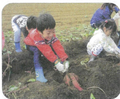
カいっばい がんばって!

参加してくれた中高生にどちらが好き？などと軽口をたたきながらの苗植え。このような何気ないやりとりで作物の品種がいろいろあることを学んでもらえればと思っています。この活動ができる