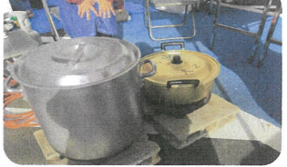
大きなお鍋で美味しく作ります