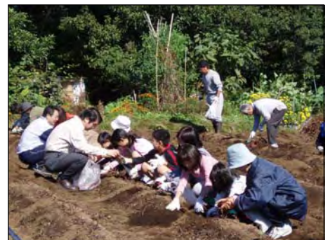
芋掘り大会 平成17年10月