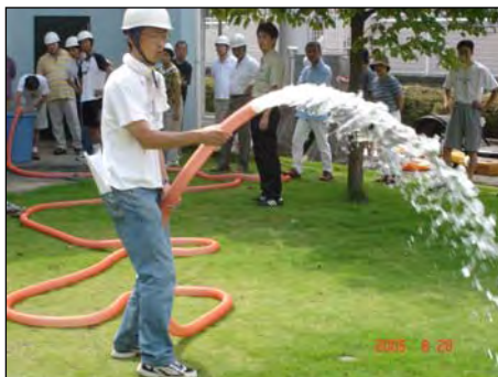
防災訓練 平成17年8月