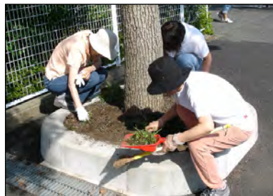
一斉清掃 平成17年9月