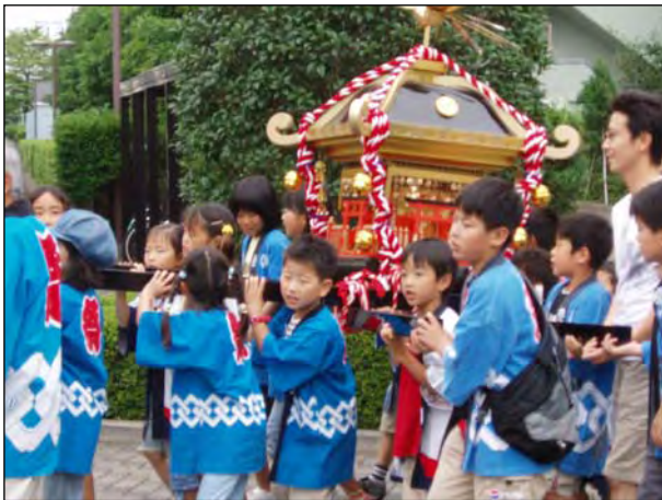
納涼大会 平成17年7月