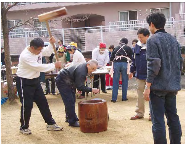
餅つき大会 平成18年1月